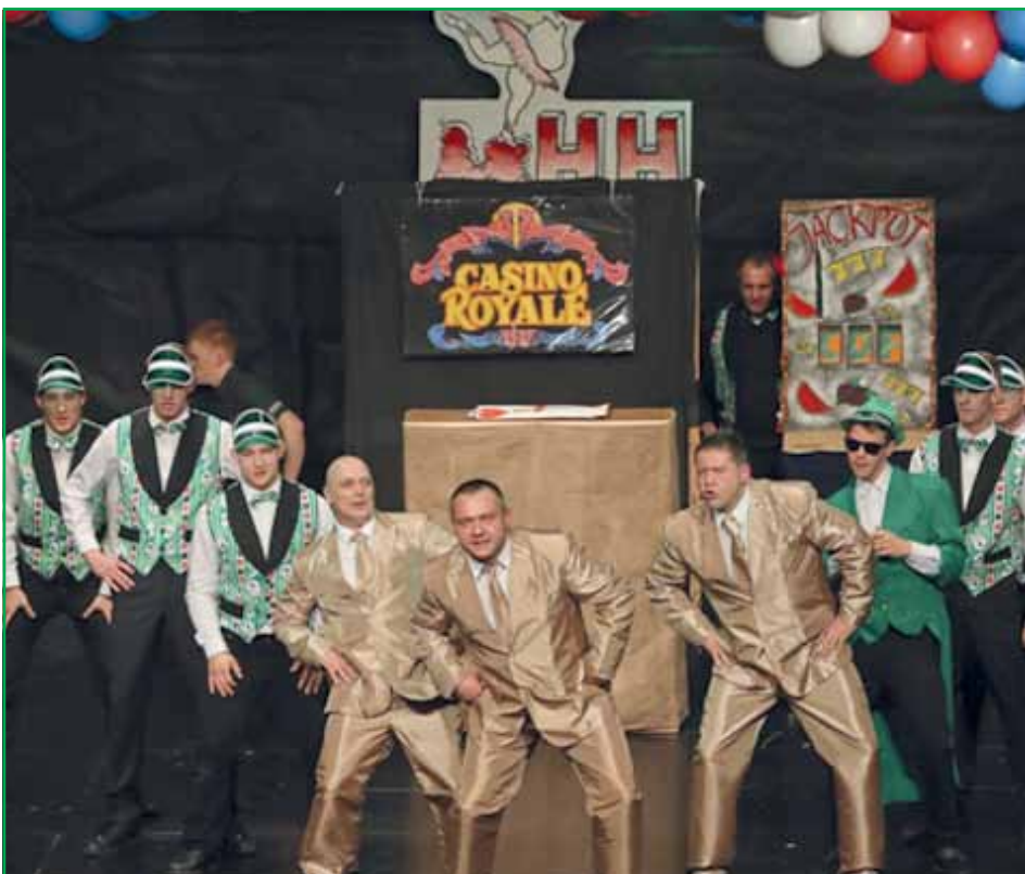
Platz 1: Faschingsgesellschaft Crottendorf

Dank für das gute Gelingen des Abends gilt allen angereisten Vereinen, den vielen Helfern, den Vereinsmitgliedern und natürlich unseren heimischen Gästen!