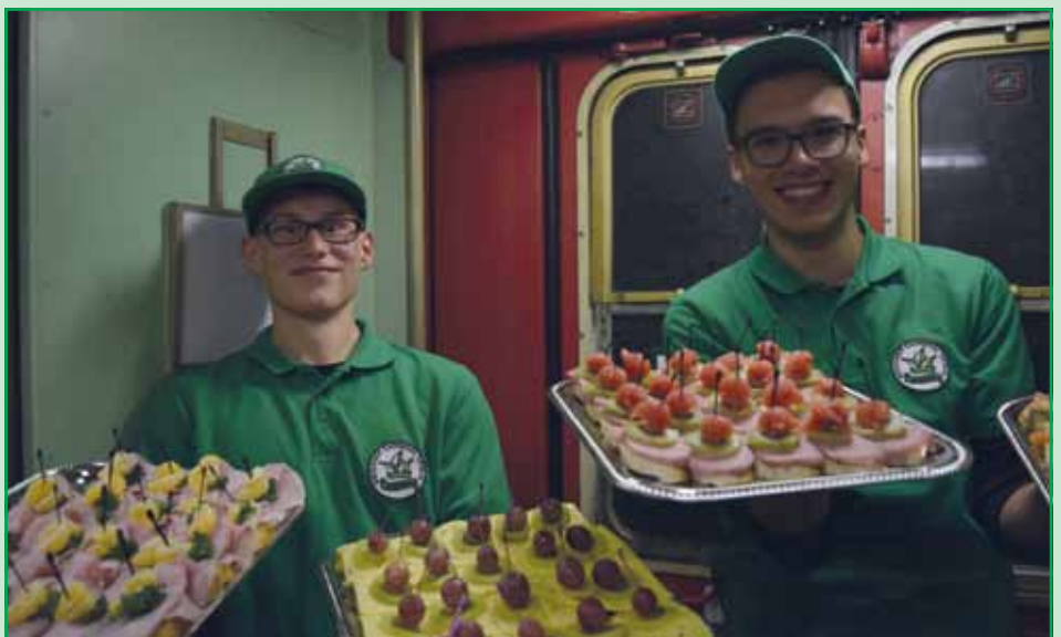
Für die Verpflegung um Zug sorgten die Mitglieder selbst.