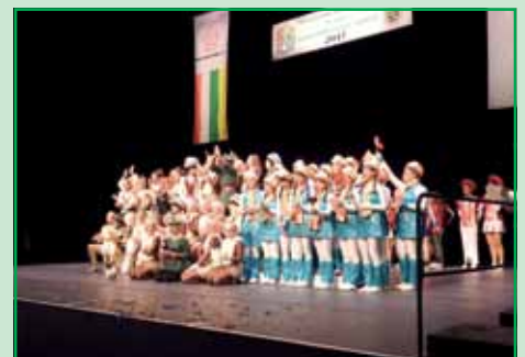
Danke für einen tollen, langen Tag!