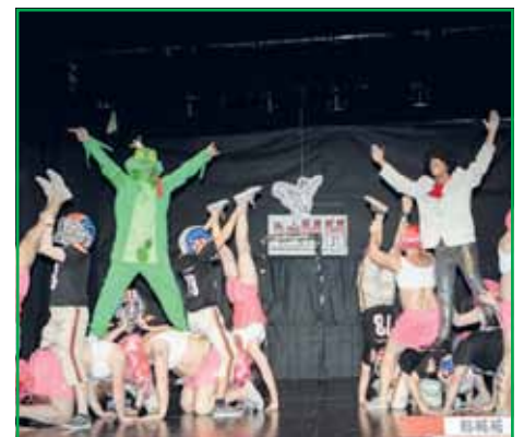
Der Gastgeber : Karnevalsclub Rot- Weiß- Hohenstein- Ernstthal