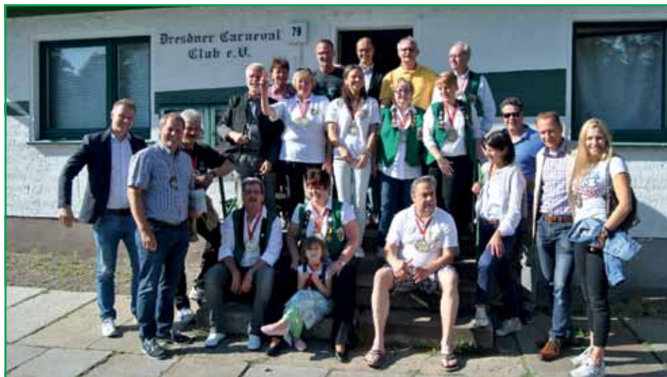
Das Festkomitee in ganz lockerer Atmosphäre beim DCC e. V.