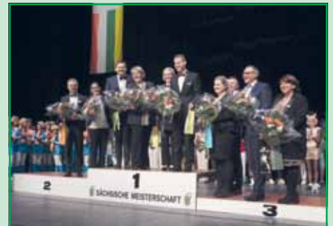
Blumen für die Juroren des BDK