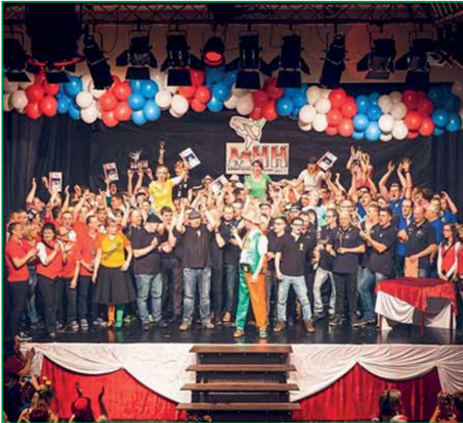
Abschlussbild aller Männerballetts bei der Siegerehrung

Beim 12. Männerballett-Wettbewerb konnte der Karnevalsclub Rot- Weiß Hohenstein- Ernstthal (RO-WE-HE) am 24.02.2017 zwölf befreundete Karnevalsvereine im Schützenhaus in Hohenstein- Ernstthal begrüßen. Nachdem sich die männlichen Ballerina nach mehrmonatigen hartem Training, unzähligen wunden Füßen und zertanzten Schuhen auf den sportlich-humoristischen Wettkampf vorbereitet hatten, bekamen die mitgereisten Betreuer, Trainer und Gäste maskuline Athleten in Höchstleistung zu sehen!