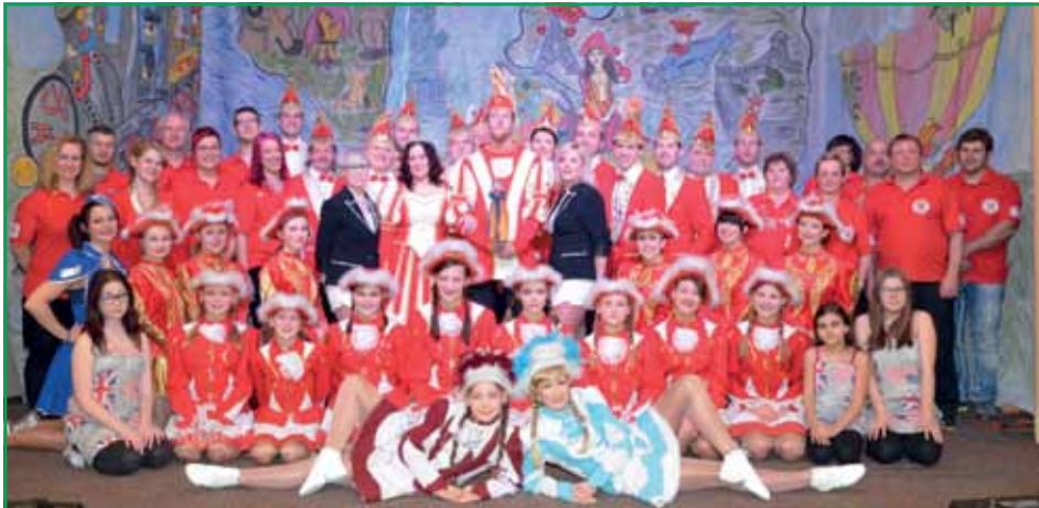
Carnevalsevereinigung Stollberg zum Jubiläum