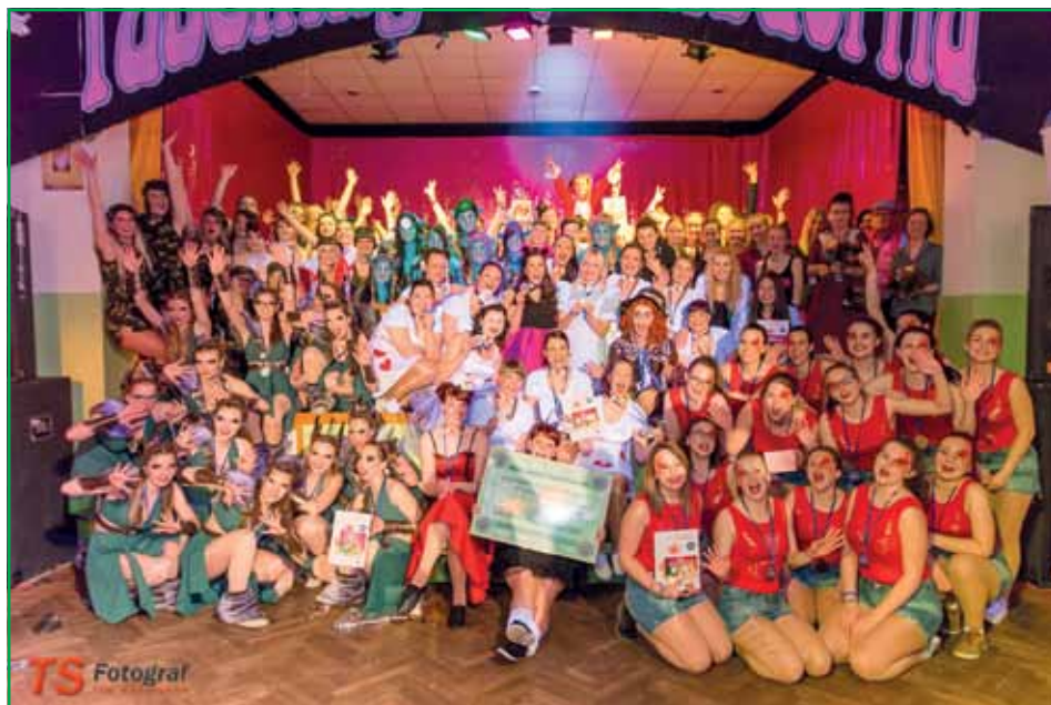
Wir waren dabei!