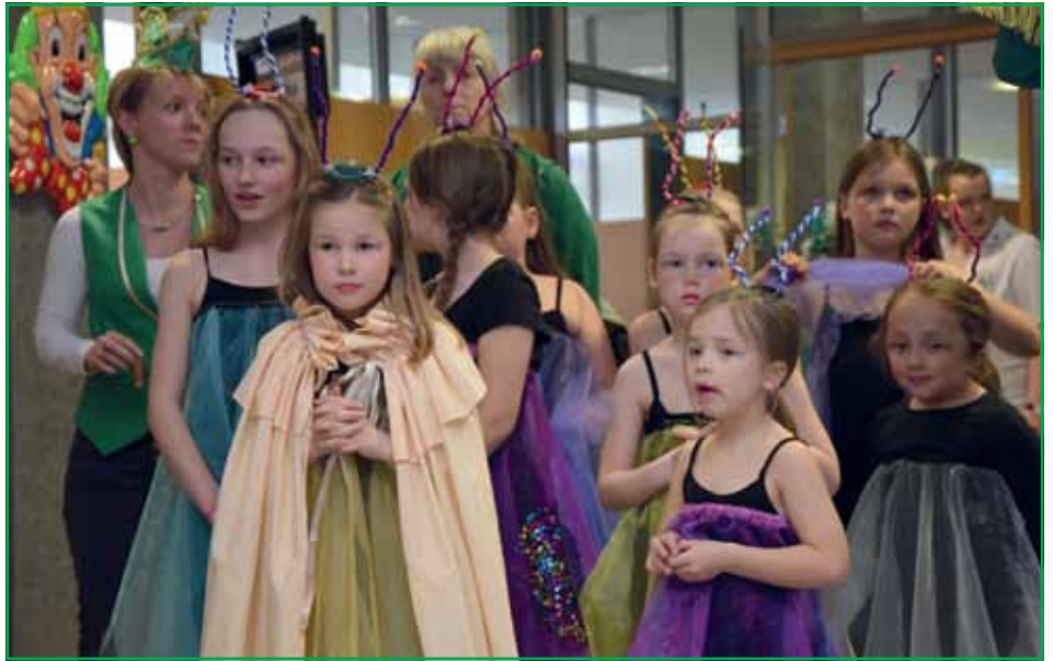
Nachwuchsgarde Meißen Showtanz

Bereits zum 21. Mal lud die Kreissparkasse Meißen die in ihrer Region ansässigen Karnevalsvereine am Faschingsdienstag ein, um den Bankalltag etwas zu verschönern. Unter Federführung des Meißner Carnivals Verein „Missnia“ waren die Karnevalisten mit kleinen Programmbeiträgen erschienen um sich so für die jahrelange Unterstützung des Unternehmens für die Brauchtumpflege zu bedanken. Der Anwesende Weinböhlauer Karnevals Verein nahm das Thema „Spaßkasse“ (Foto) etwas humoristisch auf „die Schippe“ und konnte damit sogar den Vorsitzenden der Sparkasse begeistern. Auch die Nachwuchsfunken des Meißner Carnivals Verein sorgten für eine bunte Umrahmung des Nachmittagsprogramms. Der VSC bedankte sich für die Unterstützung der regionalen Vereine und konnte die Kreissparkasse Meißen auch für das nächste Jahr zur Unterstützung der regionalen Vereine bewegen. Viele Meißner haben sich die öffentliche Veranstaltung der Kreissparkasse Meißen angesehen und waren von den Darbietungen begeistert. Sicher wird es auch 2018 wieder einen Faschingsdienstag in der Sparkasse