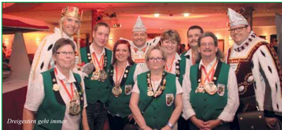
Dreigestirn geht immer.