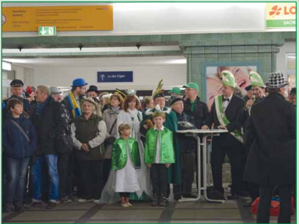
Großer Bahnhof auf dem Bahnhof. Mit kleinen Eröffnungsprogramm wurde die Dampflokfahrt eingeläutet.