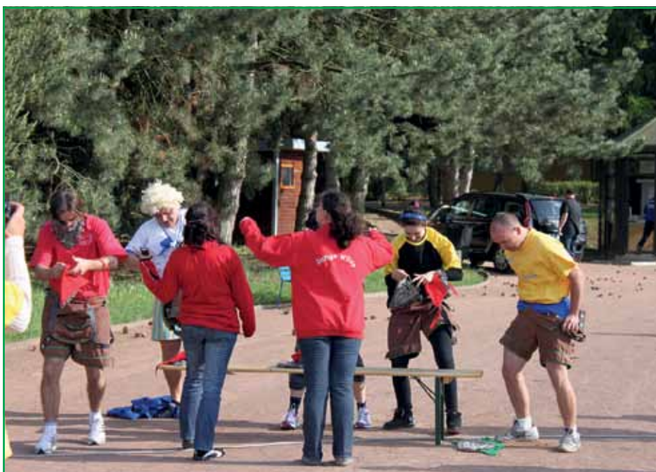
...fertig zum Start