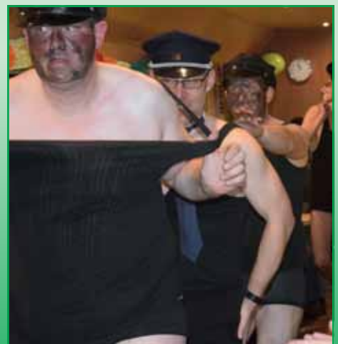
Die Heizer vom Männerballett.