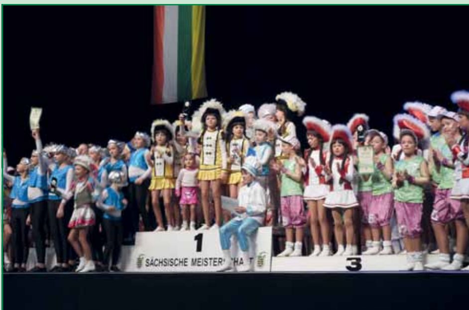
... auf ein Neues am 24.02.2018!