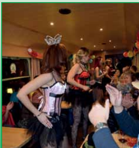
Prinzessin in Action.