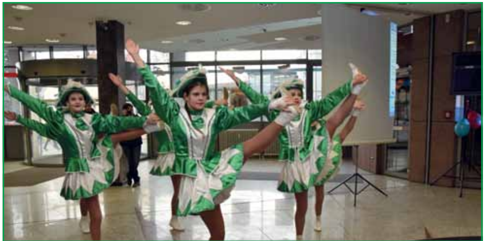
Nachwuchsfunken aus Meißen

geben, der auch den Meißnern das Brauchtum Zampfern, Schnorren, Betteln – Fasching, Fastnacht, Karneval näherbringen kann. VSC-Presse M.Rohde