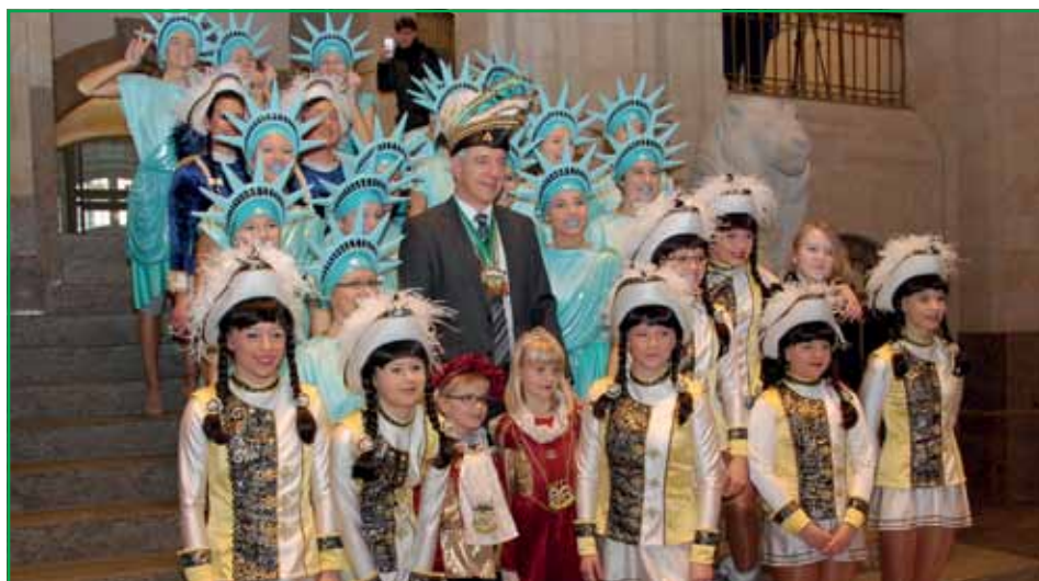
Stanislaw Tillich inmitten der Gebauer Tänzerinnen.