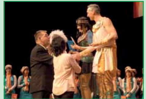
Das Siegertanzpaar kam aus Eilenburg.