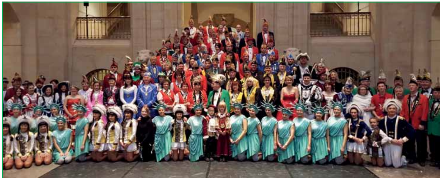
Sächsische Narren zu Gast in der Staatskanzlei

Zum wiederholten Mal hat der sächsische Ministerpräsident Stanislaw Tillich eine Abordnung des Verbands Sächsischer Carneval e.V. empfangen. Etwa 120 Mitglieder verschiedener Vereine des VSC aus ganz Sachsen waren dazu in die Staatskanzlei gereist. Neben dem Dank der Karnevalisten für die Einladung, welche Präsident Günter Bührichen überbrachte, wurde der Ministerpräsident mit einem sächsischen Orden geehrt. Viel Freude unter den anwesenden Karnevalisten kam auch dadurch auf, dass unser Ministerpräsident zu diesem Empfang mit der im Vorjahr erhaltenen Ehrenkappe