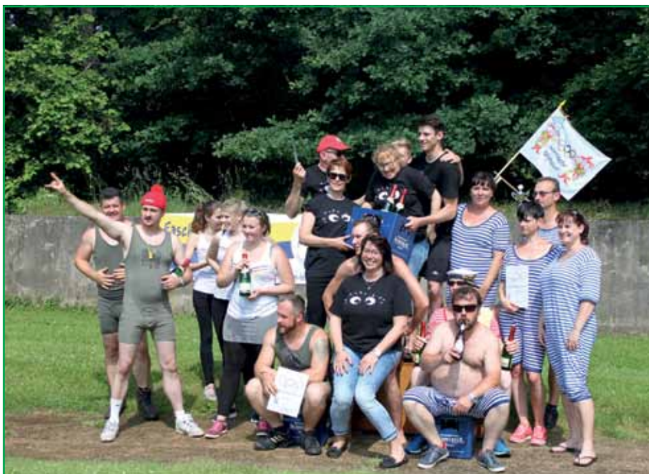
Siegerpose für die Presse

Gestartet wird die Veranstaltung stets durch einen olympischen Fackelläufer, welcher das olympische Feuer entzündet. Neben fest verankerten Disziplinen, wie zum Beispiel Gummistiefelweitwurf, wird seitens der Veranstalter versucht, jedes Jahr neue Spiele zu integrieren. Somit kommt keine Langeweile auf und die Vereine müssen sich überraschen lassen, welche Disziplinen am Tag stattfinden. Für gute Laune und jede Menge Spaß ist an diesem Tag gesorgt. Eine Mannschaft wird aus drei weiblichen und drei männlichen „Sportlern“ (oder solchen die so aussehen!) gebildet. Mit der Zeit hat auch die Jugend der Ehrgeiz so stark gepackt, dass die Anfrage kam, ob sie auch eine Mannschaft stellen dürfen. Von Seiten der Organisatoren gab es natürlich kein Veto,