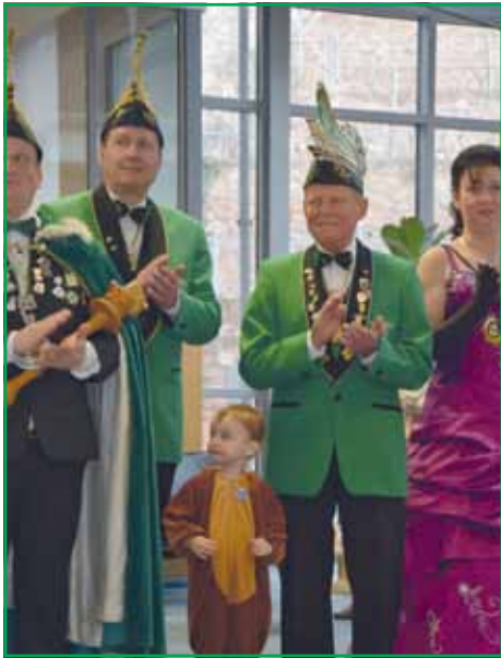
Regionalvertreter des VSC