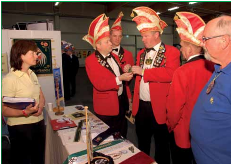
Fachgespräche beim karnevalistischen Markt

dem Vorstand Bericht über den Erfüllungszustand zu geben.